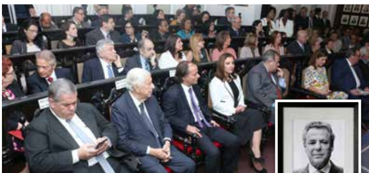
Na sessão com plenário lotado, também foi inaugurado o retrato de Técio Lins e Silva na Galeria dos Ex-presidentes

o tratamento justo e de igualdade entre todos os seres humanos. Nós, mulheres, não precisamos ter comportamento masculino para afirmar a nossa importância social, profissional e política”.