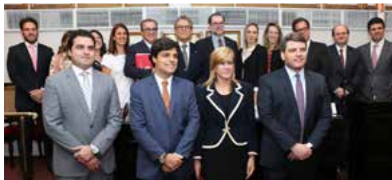
O presidente e os novos membros do IAB no plenário