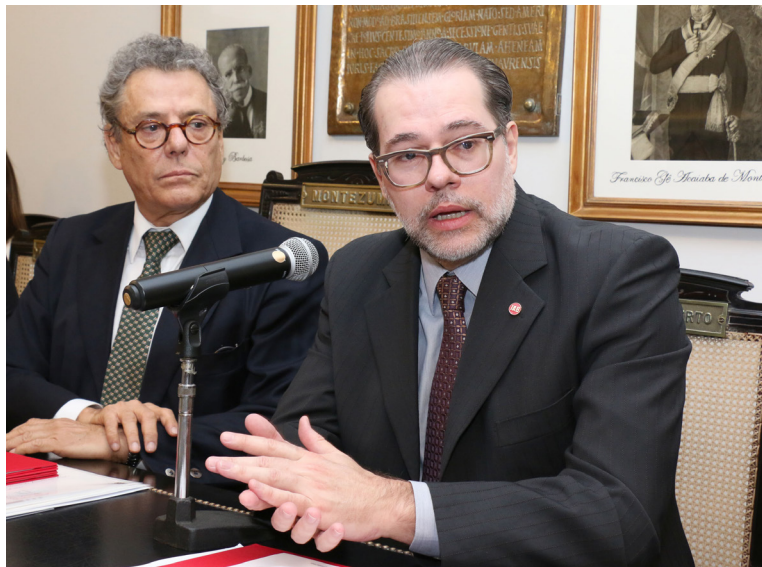
Tércio acompanha o discurso emocionado do ministro Dias Toffoli

Dias Toffoli traçou um paralelo entre o papel do IAB durante o Império e a sua missão como advogado-geral da União, cargo que ocupou antes de ingressar no STF. “De certo modo, fui herdeiro da função exercida pelo IAB, que era, por lei, no século XIX, o consultor de Dom Pedro II, pois opinava nos atos imperiais”, afirmou o ex-titular da AGU, instituição que representa a União no campo judicial e extra-